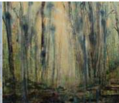
Shinrin Yoku (2024)