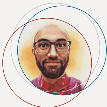
di Paolo Ceruti da Hong Kong

T anti anni fa qualcuno mi aveva mostrato la piccola cappella nella stazione Centrale di Milano, accanto ai binari, sempre aperta, posto tranquillo e mai vuoto: ho sempre trovato qualcuno dentro seduto ad aspettare il treno, riposare o forse pregare.