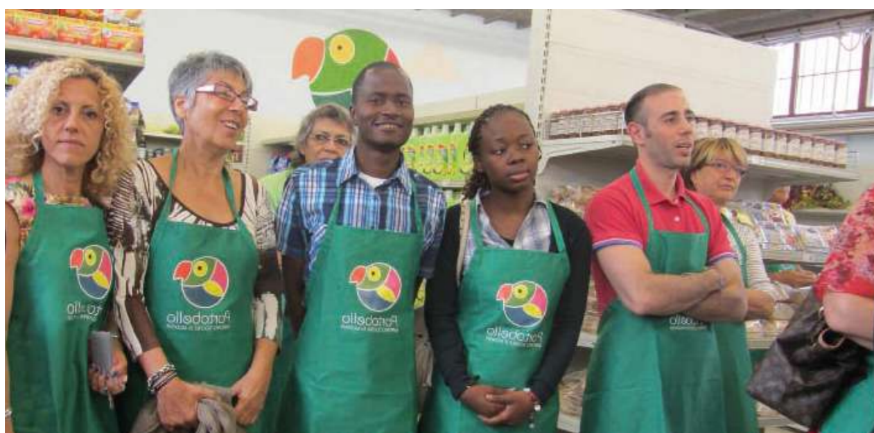
Volontari Emporion Sondrio

Queste trasformazioni, inevitabilmente, hanno avuto delle ripercussioni anche sul volontariato: se la società è l'insieme delle nostre relazioni e se le relazioni sono cambiate, cambia anche il modo di fare volontariato. Oggi il volontariato è diventato più occasionale,