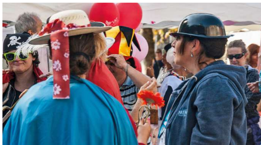
Manifesta 2018 a Lecco

Ci tengo a ricordare che durante la pandemia tutti hanno chiuso, tranne i volontari".