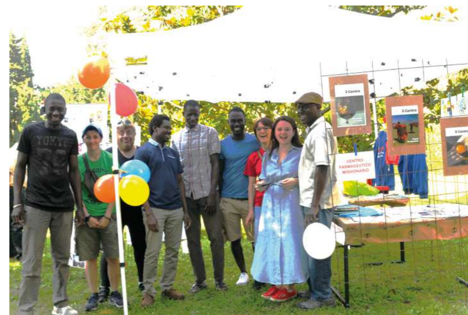
Nelle foto alcuni momenti della festa delle associazioni.

sociazione è nato proprio da rapporti umani significativi. Successivamente ci hanno chiesto di scrivere su un post-it delle parole che descrivono l'associazione; per il CFM ho scelto: SENTIRSI ACCOLTI - INTEGRAZIONE - DIGNITA'. Ci siamo poi divisi in tre gruppi per scambiare qualche idea su questi temi: Organizzazione - Azione - Comunicazione; avendo come sfondo il pensiero di come poter inserire nuove persone all'interno delle associazioni. Il rimando più significativo che porto a casa è che in un'associazione, pur essendo in tanti, si lavora con obiettivi comuni ed esiste uno statuto, ancor prima però, ciascun membro, ha le proprie motivazioni che lo spingono a far parte dell'associazione. Le motivazioni di altri non sono le mie e per stare insieme è importante che la mia motivazione non sia il metro di giudizio di quella degli altri." Non resta che continuare a sostenere il valore dell'essere volontari all'interno di un'associazione, quale migliore espressione di cittadini che insieme si impegnano prestando servizio, avendo a cuore anzitutto il BENE dell'altro.