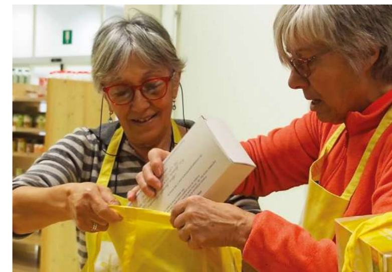
“Volontarie Progetto+++ Sondrio”