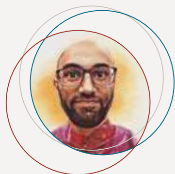
di Paolo Ceruti da Hong Kong

H ong Kong, come tutte le megalopoli dove tante persone vivono insieme in uno spazio ridotto, ha il problema di dove mettere i non pochi rifiuti (in media 900 kg annui pro capite dicono le statistiche). Non c'è l'inceneritore a Hong Kong e tutti i rifiuti vengono raccolti nelle strade, portati in centri di smistamento e poi distribuiti nelle varie discariche, che altro non sono che i futuri parchi o zone di costruzione. Sì perché a Hong Kong lo spazio vale oro, anche lo spazio occupato dai rifiuti è prezioso e una volta che i rifiuti hanno riempito lo spazio destinato, si crea un piano dove nascono costruzioni nuove, anche il mare viene riempito con gli scarti degli edifici abbattuti e mano a mano si crea nuova terra su cui costruire.