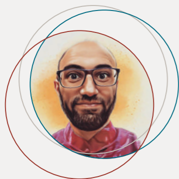
di Paolo Ceruti da Hong Kong

Il centro commerciale è un posto interessante, qui a Hong Kong ce ne sono centinaia e sono davvero luoghi centrali per la vita delle persone. Metro, bus, traghetti, case, uffici, cinema, ristoranti, negozi, banca... tutto parte o arriva in un centro commerciale. Sono luoghi di passaggio, di ritrovo, di svago, di lavoro. Sono luoghi pieni di vita, di umanità. Nei centri commerciali ci sono sempre decorazioni, ogni momento dell'anno ha qualche cosa speciale.